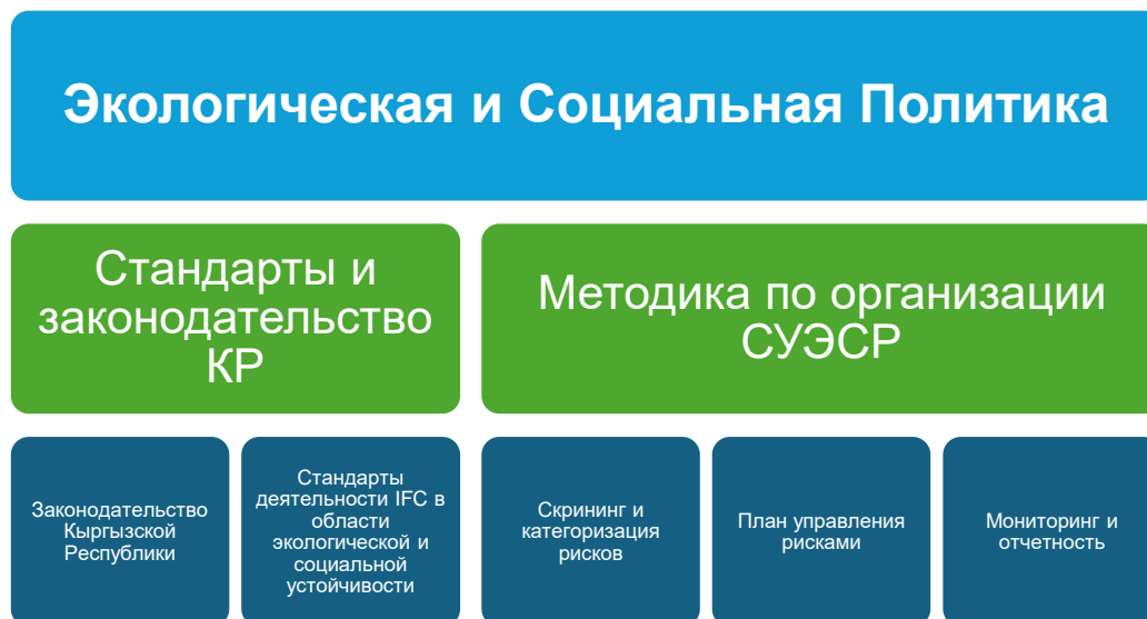
Схема 1 Система Управления Экологическими и Социальными Рисками